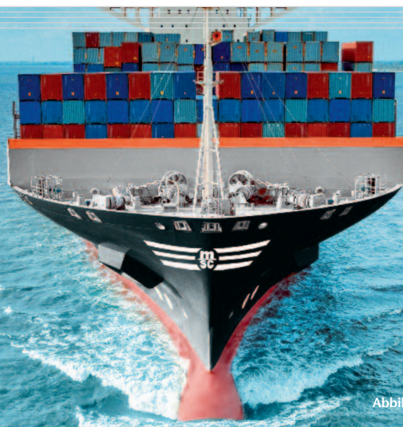
Abbildungen: Baugleiche Schwesterschiffe der "E.R. Benedetta"