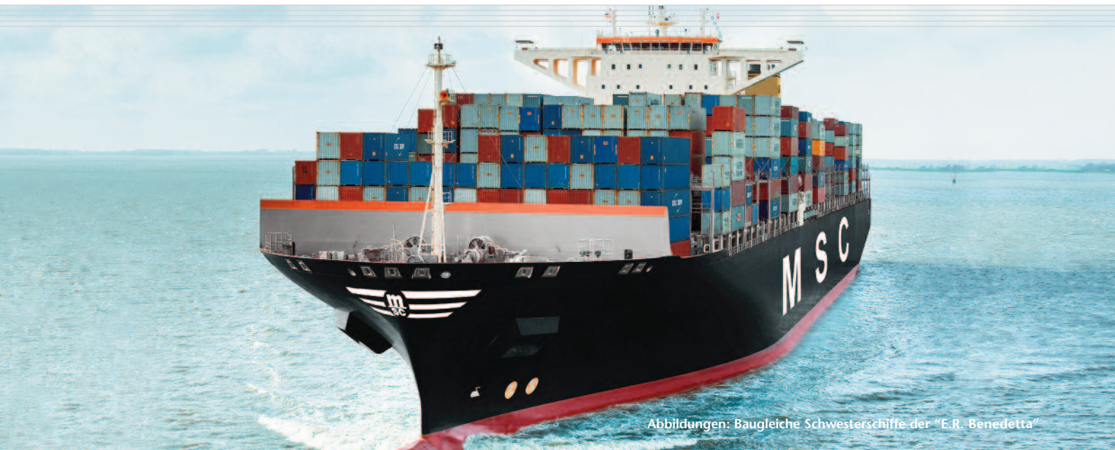
Abbildungen: Baugleiche Schwesterschiffe der "E.R. Benedetta"